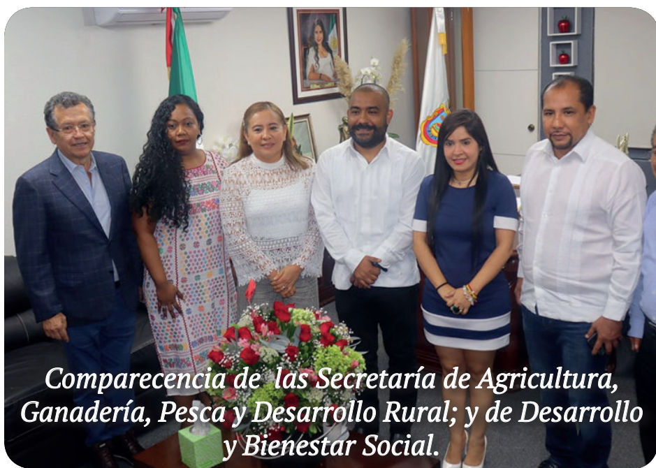
Comparecencia de las Secretaría de Agricultura, Ganadería, Pesca y Desarrollo Rural; y de Desarrollo y Bienestar Social.