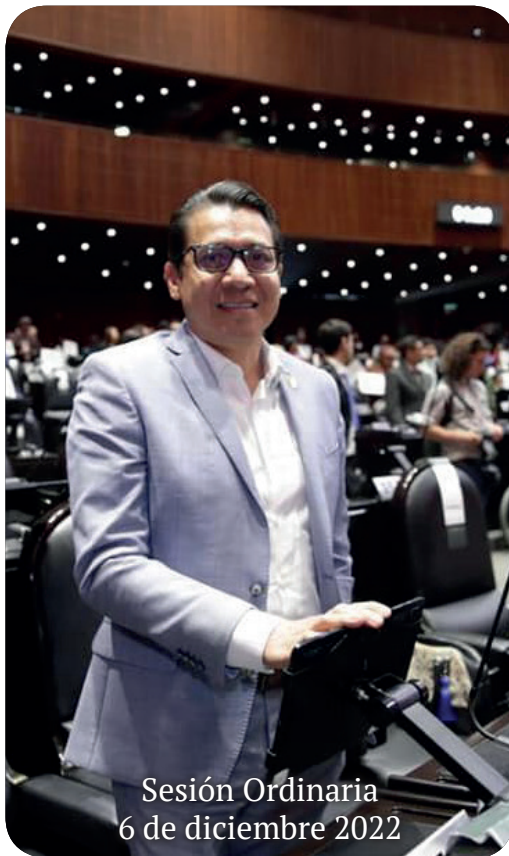
Sesión Ordinaria 6 de diciembre 2022