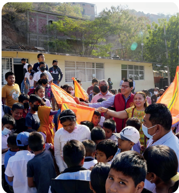
Apoyo económico para el pago de la maquinaria pesada que realizó el retiro de tierra en la Esc. Prim. Benito Juárez, ubicada en la Colonia Benito Juárez de Tlapa de Comonfort, Gro.