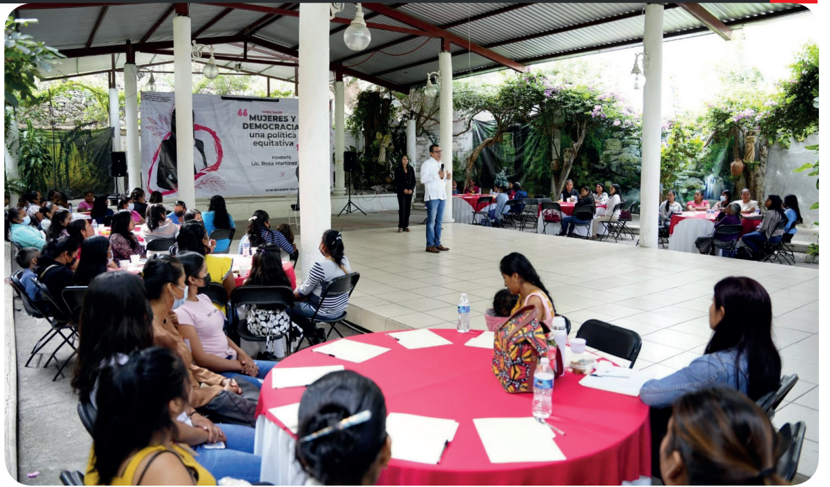
19 de noviembre 2022, Tlapa de Comonfort, Gro.- Curso taller para la Capacitación, promoción y desarrollo de liderazgo político de las mujeres: “Mujeres y democracia: una política equitativa”.