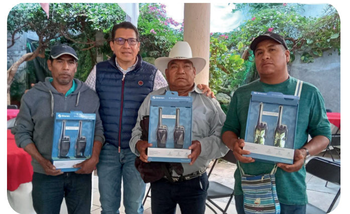
Apoyo al nuevo comisariado de la comunidad de Aquilpa del Municipio de Tlapa de Comonfort, Gro.