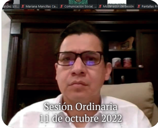
Sesión Ordinaria 11 de octubre 2022