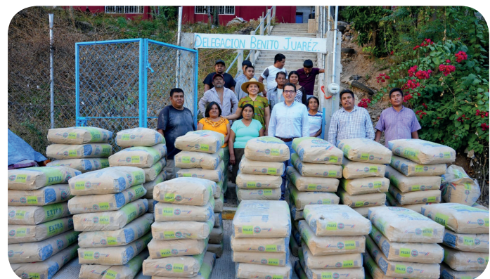
Apoyo con 5 toneladas de cemento y otros materiales de construcción para la ampliación de la delegación Col. Benito Juárez Municipio de Tlapa de Comonfort, Gro.