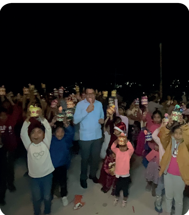
momentos de Paz, Amor y Unidad Familiar con las niñas y niños de la colonia Lazaro Cardenas del municipio de Tlapa de Comonfort