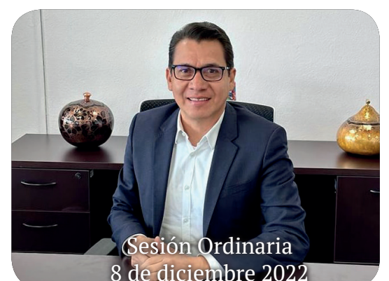
Sesión Ordinaria 8 de diciembre 2022