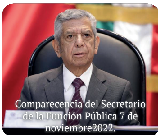
Comparecencia del Secretario de la Función Pública 7 de noviembre 2022.