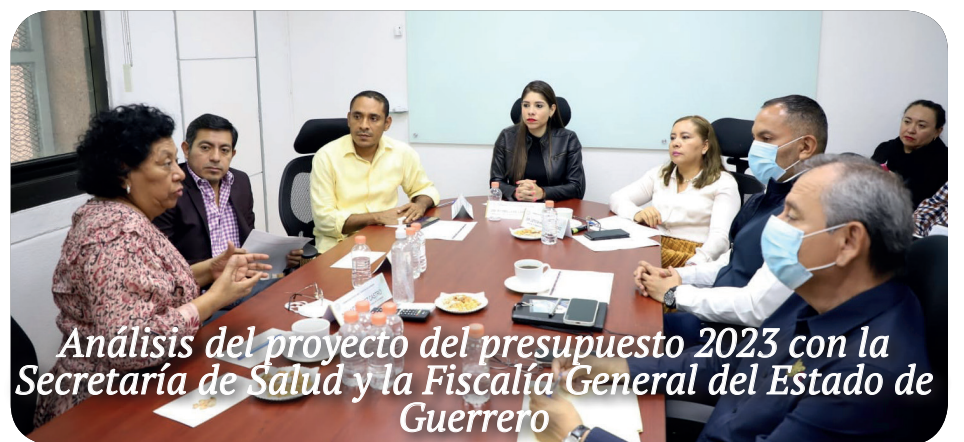
Análisis del proyecto del presupuesto 2023 con la Secretaría de Salud y la Fiscalía General del Estado de Guerrero