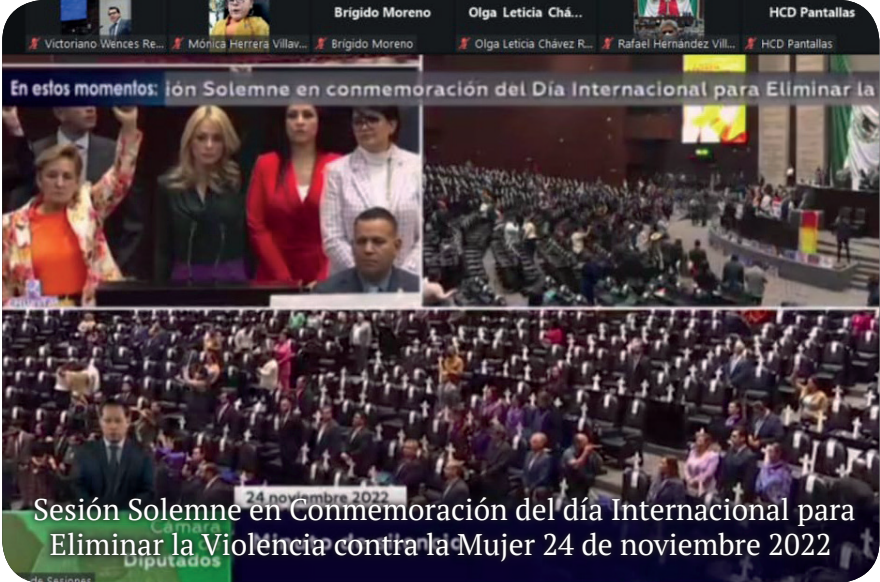
Sesión Solemne en Conmemoración del día Internacional para Eliminar la Violencia contra la Mujer 24 de noviembre 2022