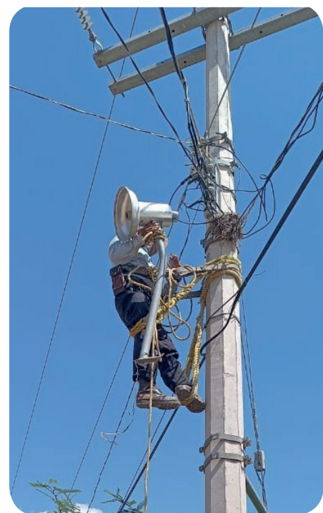
Rehabilitación de solicitud de lámparas del alumbrado público. de la Col. Las #Águilas del Municipio de Tlapa de Comonfort, Gro.