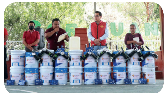
Apoyo con pintura de aceite y agua para para pintar la Escuela Secundaria Sor Juana Inés de la Cruz, ubicada en la Col. Pirámides de Contlalco, Tlapa de Comonfort, Gro.