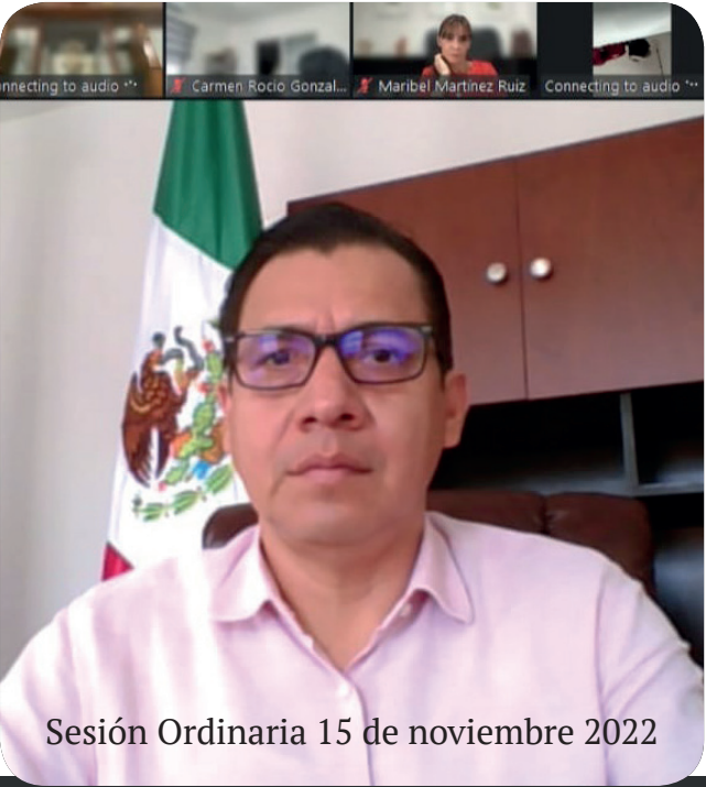
Sesión Ordinaria 15 de noviembre 2022

(1) Presupuesto de Egresos de la Federación para el Ejercicio Fiscal 2023 (en lo general y en lo particular los artículos no modificados)