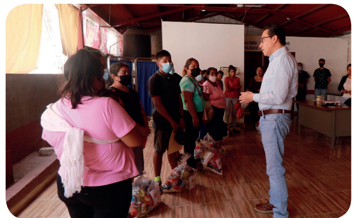
Apoyo a la Esc. Prim Luis Donaldo Colosio Murrieta y a la Esc. Telesecundaria Albert Einstein del municipio de Teloloapan, Gro.