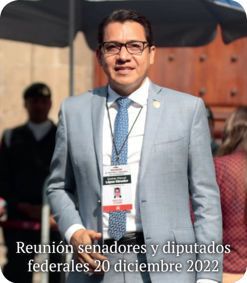
Reunión senadores y diputados federales 20 diciembre 2022