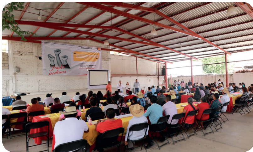
16 de octubre de 2022, Tlapa de Comonfort, Gro.- Curso de educación y capacitación política “Cultura política, participación ciudadana para una sociedad democrática”