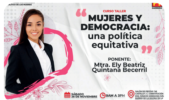
26 de noviembre 2022, Ometepepec, Gro.- Curso taller para la Capacitación, promoción y desarrollo de liderazgo político de las mujeres: “Mujeres y democracia: una política equitativa”.