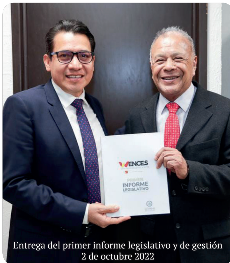
Entrega del primer informe legislativo y de gestión 2 de octubre 2022