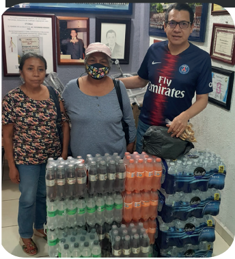
19 de noviembre 2022, Tlapa de Comonfort, Gro.- Curso taller para la Capacitación, promoción y desarrollo de liderazgo político de las mujeres: "Mujeres y democracia: una política equitativa".