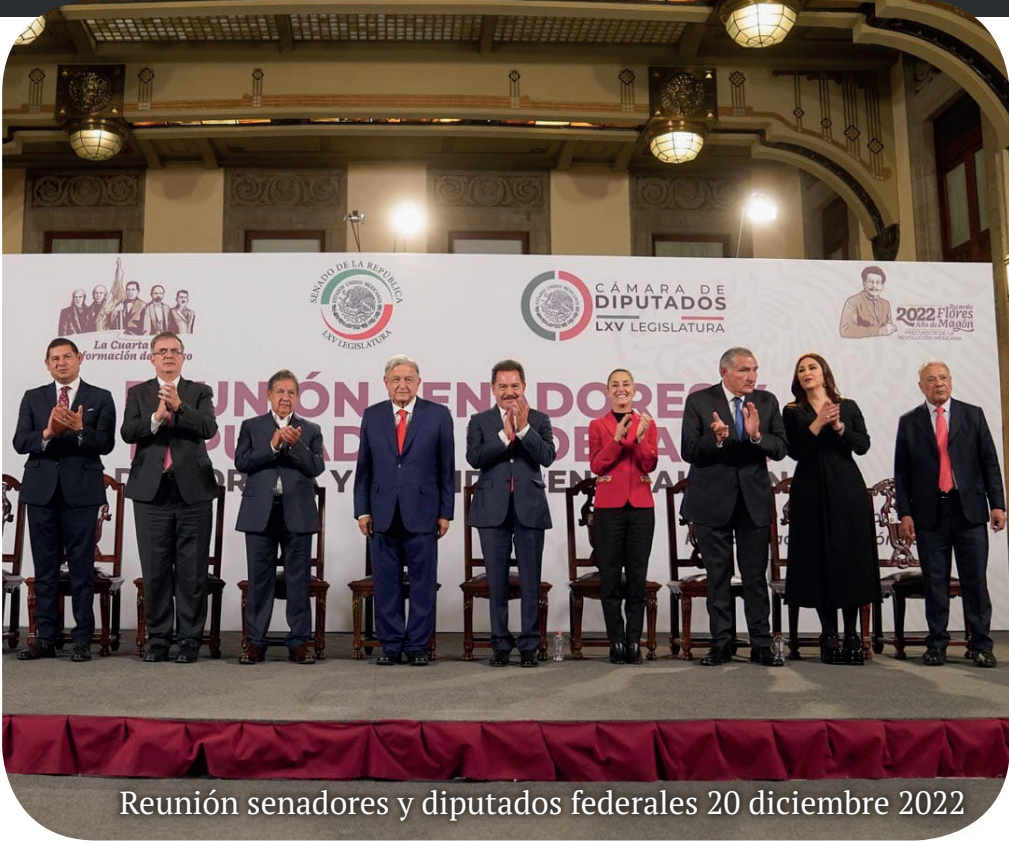
Reunión senadores y diputados federales 20 diciembre 2022

año fiscal 2023, que permaneció sin incremento de impuestos para la ciudadanía, además de diversas iniciativas entre las que destacan: La promoción del lenguaje incluyente para asegurar la paridad de género en los órganos de la secretaría de turismo, impedir la discriminación por motivos de género, orientación sexual, embarazo o situación migratoria, el promover la certificación para impulsar la participación laboral de mujeres y personas jóvenes, el Establecer que las instituciones de seguridad pública de la federación, las entidades federativas y municipales propmuevan la realización de acciones y programas de capacitación en materia de paridad de género, atención de calidad para personas con discapacidad y grupos vulnerables, el garantizar la construcción y mejoramiento de vivienda en beneficio de pueblos originarios y afroamericanos.