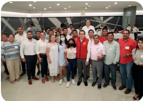
23 de octubre de 2022, Acapulco de Juárez, Gro.- Curso de educación y capacitación política “Cultura política, participación ciudadana para una sociedad democrática”