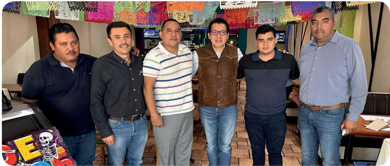
17 de julio 2022, Tlapa de Comonfort, Gro.- Reunión regional con coordinadores del Partido del Trabajo, con una visión clara en la ruta 2024.