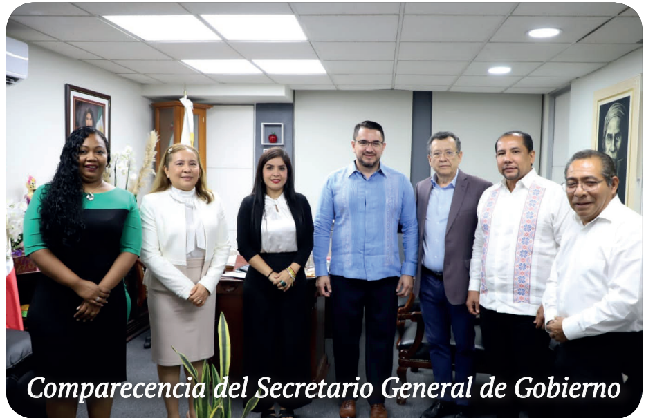
Comparecencia del Secretario General de Gobierno