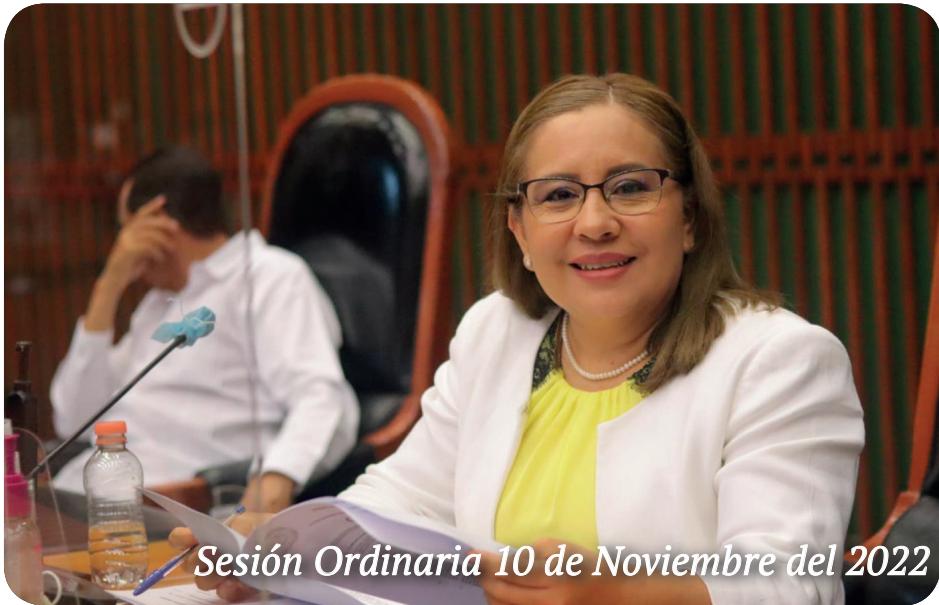
Sesión Ordinaria 10 de Noviembre del 2022

Proceso de Consulta a pueblos y comunidades Indígenas y Afromexicanos en las diferentes colonias y comunidades del municipio de Tlapa de Comonfort, Gro.