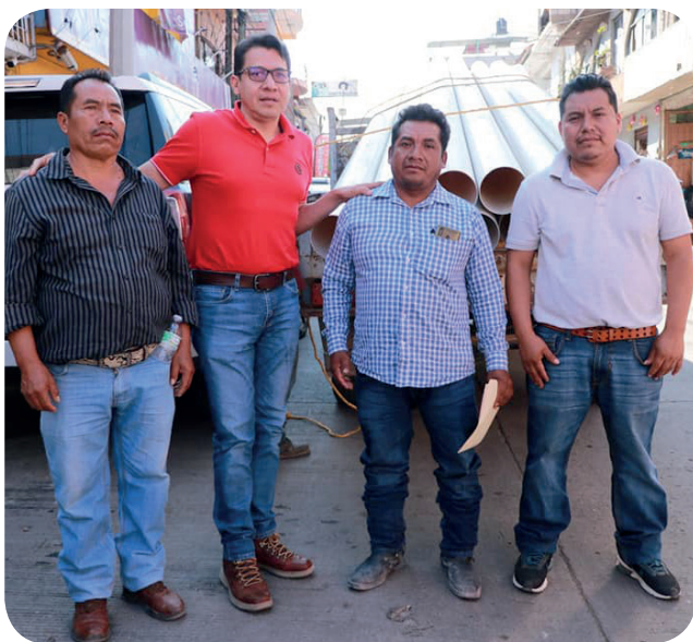
Apoyo y solidaridad con los vecinos y autoridad de la Col. Vicente Guerrero, Municipio de Tlapa de Comonfort, Gro.