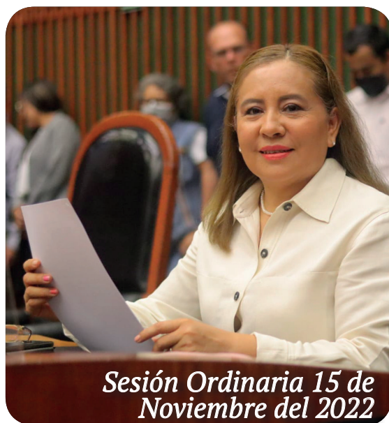
Sesión Ordinaria 15 de Noviembre del 2022