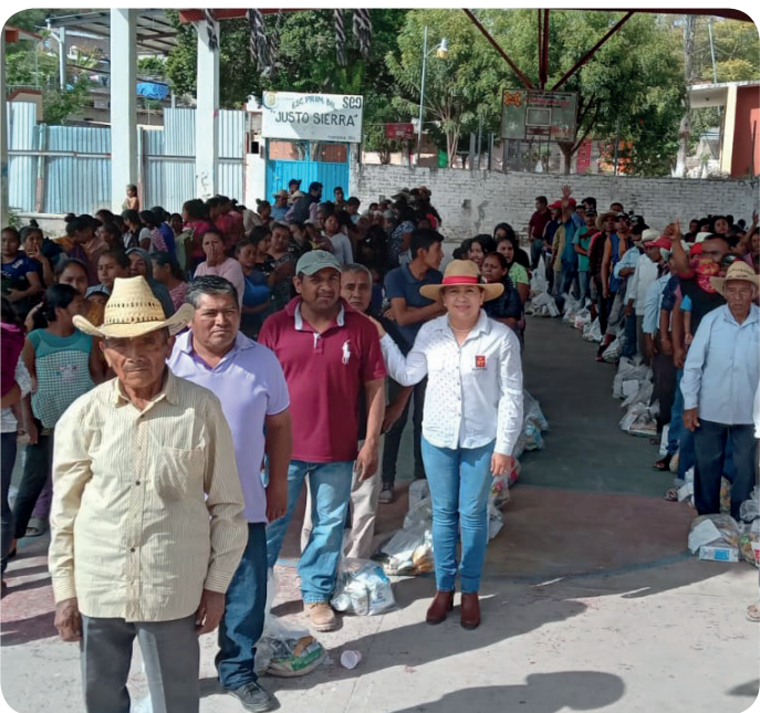
Apoyo solidario a la policía comunitaria de Tototepec, Tlapa de Comonfort, Gro.