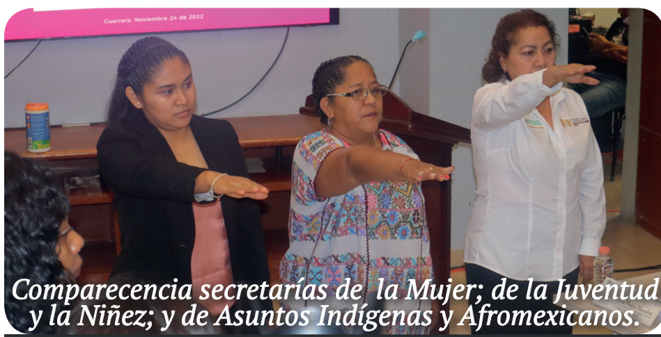
Comparecencia secretarías de la Mujer; de la Juventud y la Niñez; y de Asuntos Indígenas y Afromexicanos.