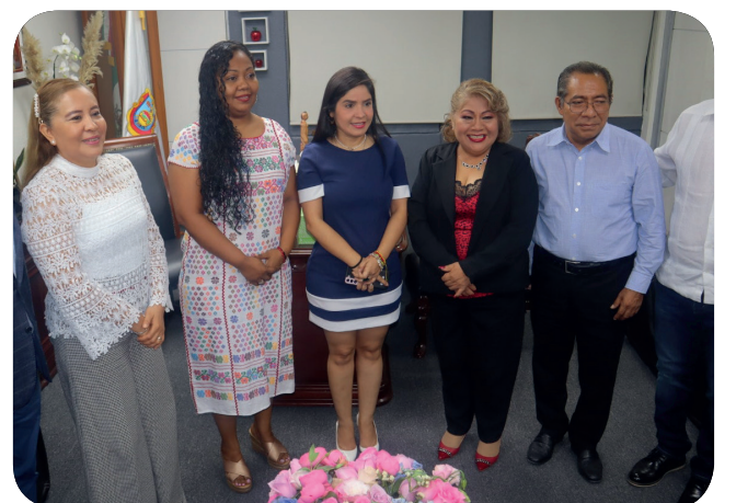
Comparecencias de las Secretarías de Desarrollo Urbano, Obras Públicas y Ordenamiento Territorial; de Agricultura, Ganadería, Pesca y Desarrollo Rural; y de Desarrollo y Bienestar Social.