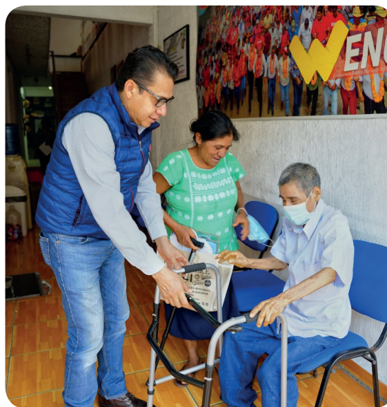
Apoyo solidario con personas con discapacidad de las tercera edad con aparatos funcionales que les permitirán tener mayor movilidad y con ello una mejor calidad de vida.