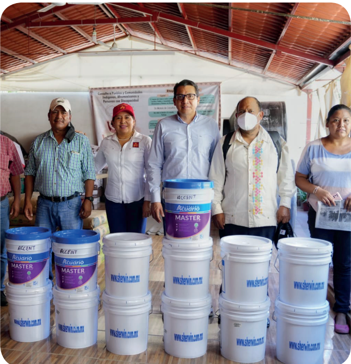
Apoyo solidario con pintura para autoridades de Ahuatepec Pueblo y Ahuatepec Ejido del Municipio de Tlapa de Comonfort, Gro., y a líderes del municipio de Alcozauca, Gro.