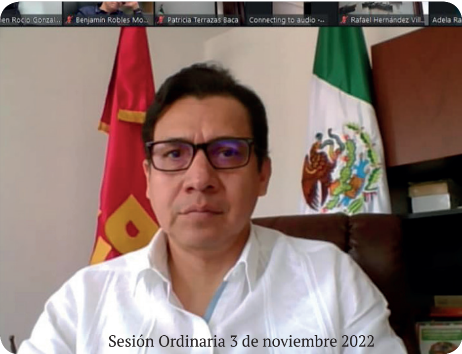
Sesión Ordinaria 3 de noviembre 2022