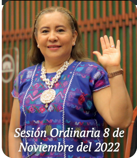
Sesión Ordinaria 8 de Noviembre del 2022