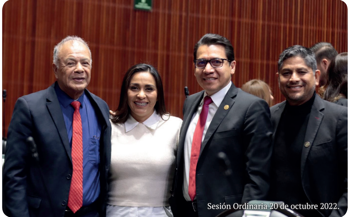
Sesión Ordinaria 20 de octubre 2022.