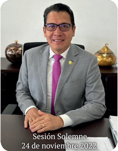
Sesión Solemne 24 de noviembre 2022