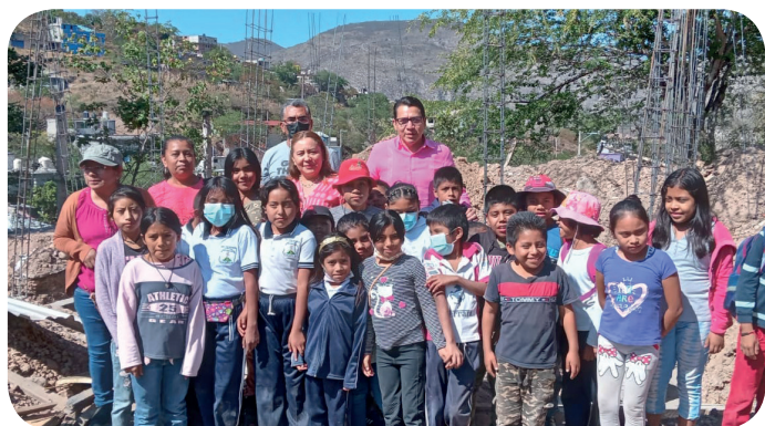
Avance de la construcción de 2 aulas de la Esc. Primaria Juan Aldama Caballero de la Col. Tepeyac, Municipio de Tlapa de Comonfort, Gro.