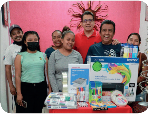
Apoyo a la Escuela Primaria Nicolás Bravo T.V. de la Col. Aviación del Municipio de Tlapa de Comonfort.