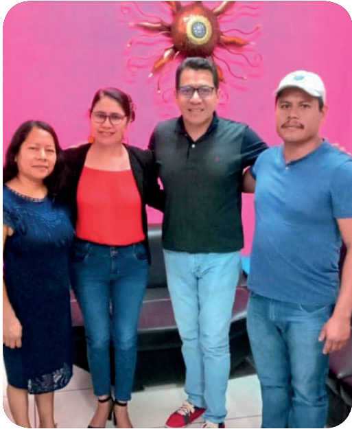
Apoyo a los compañeros maestros coordinadores IX Congreso Estatal Ñuu Savi: La institucionalización del Tu'un Savi y la Socialización de su Norma de Escritura; en el marco del Decenio Internacional de las Lenguas Originarias 2022-2032, proclamado por la UNESCO.