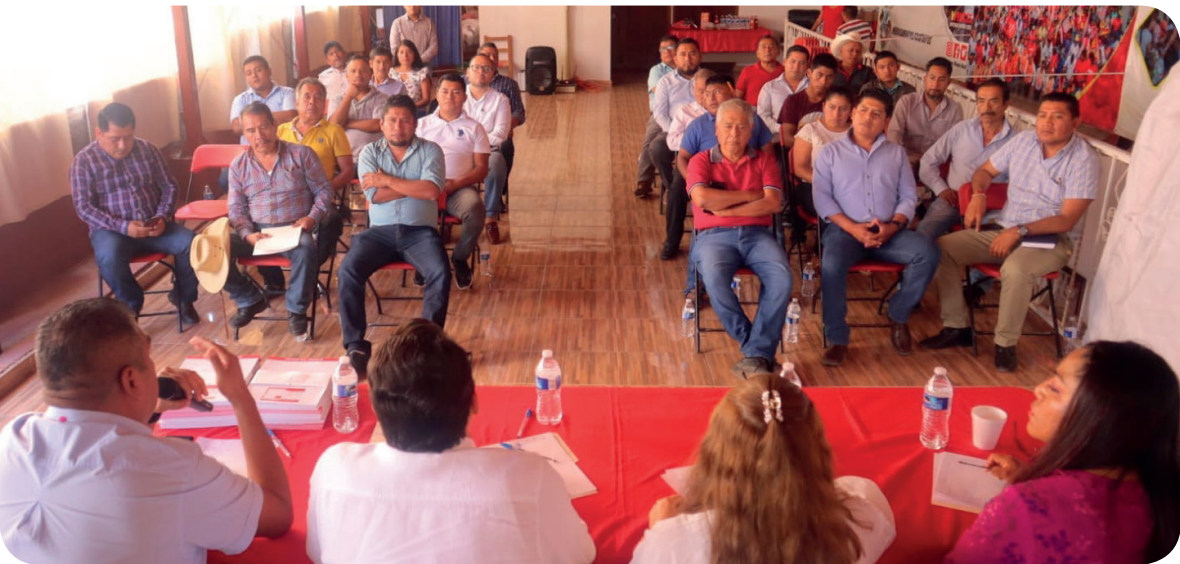
4 de diciembre 2022, Tlapa de Comonfort, Gro.- Reunión regional con coordinadores municipales del Partido del Trabajo, continuamos diseñando la ruta 24.